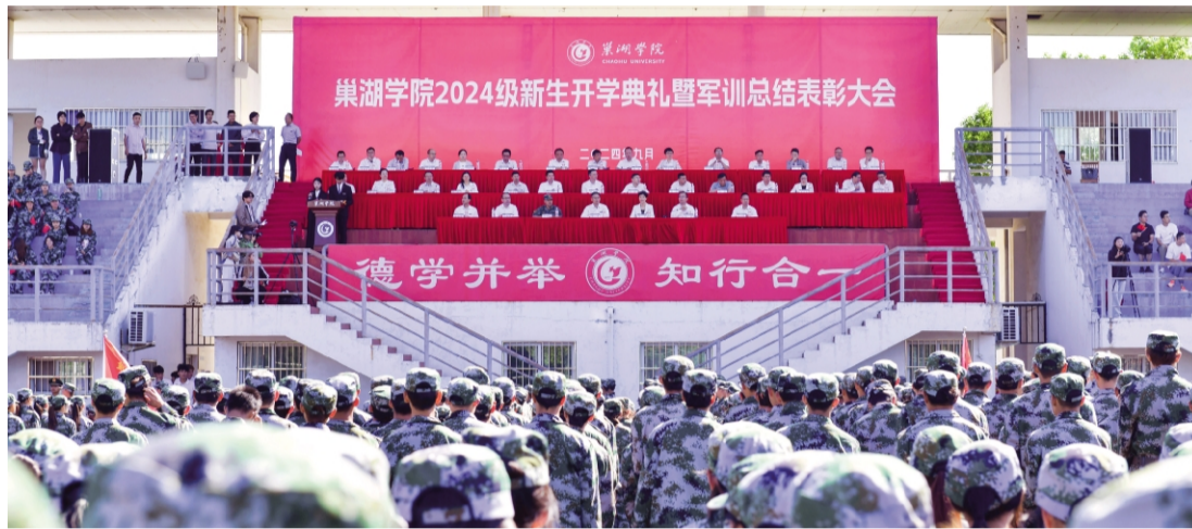
巢湖学院 2024 级新生开学典礼暨军训总结表彰大会现场,学子们身着迷彩服,整齐列队,展现出昂扬向上的精神风貌。

张莉代表学校向新入学的 4448 名本科生、43 名联合培养研究生、7 名国际生表示热烈欢迎,对学生家长和教师们表示敬意,对教官们致以诚挚感谢。张莉寄语新同学,希望同学们胸怀“国之大者”,坚定理想信念,厚植家国情怀,志存高远,理想远大,主动将个人之梦汇聚于国家之梦、民族之梦,以小梦共筑大梦,以小我成就大我;希望同学们坚持崇德向善,夯实成才基础,涵养高尚品格,把立德修身摆在为人处事的第一位,主动适应时代之变、环境之变、学习之变,以开放的心态拥抱变化、迎接挑战;希望同学们敢于“自讨苦吃”,永葆奋斗姿态,绽放绚丽青春,积极参加社会实践、实习实训,以行求知,以知促行,在青春的赛道上斩获属于个人的高光时刻,奋力书写为中国式现代化挺膺担当的青春篇章。