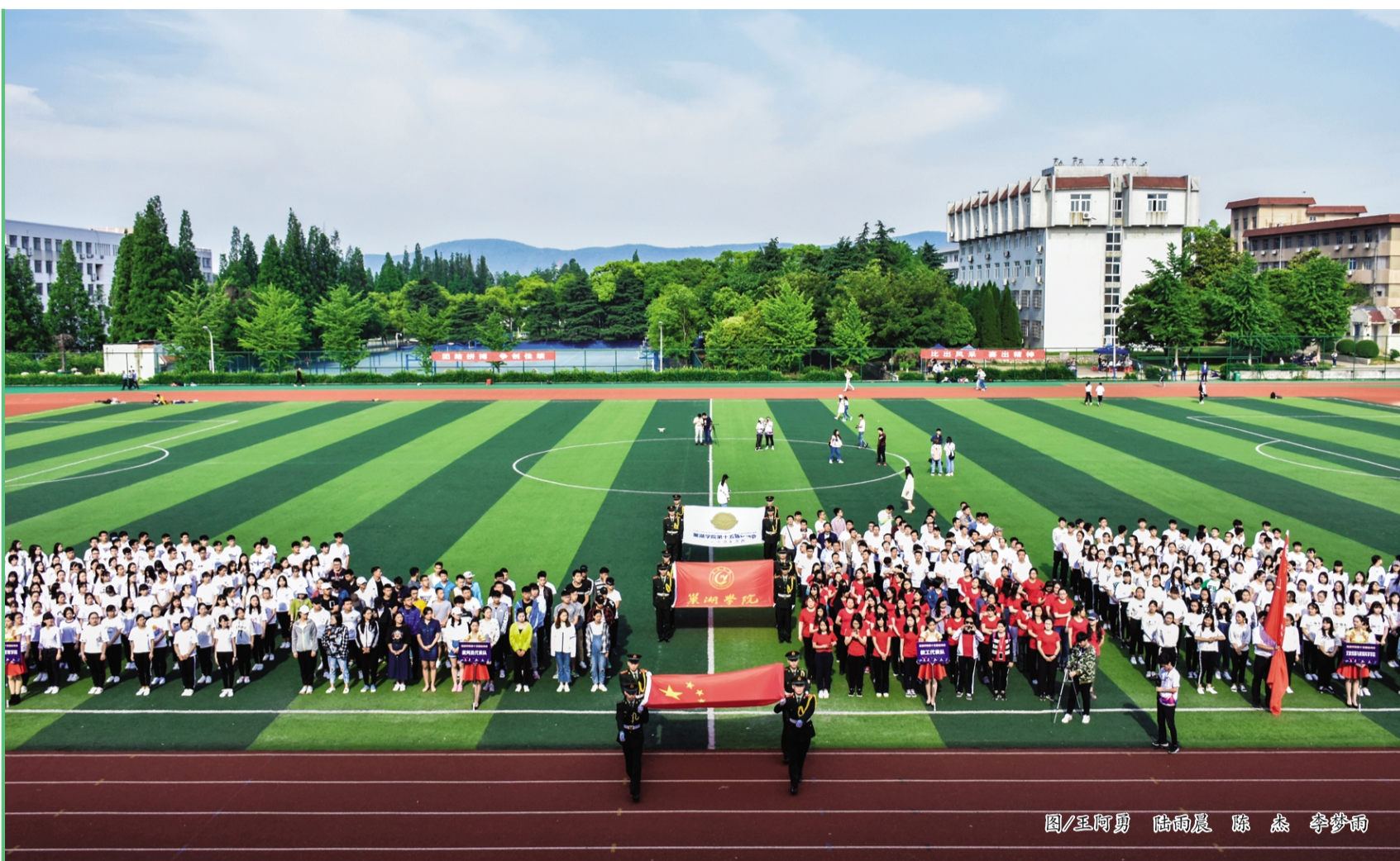
图/王阿勇 陆楠辰 陈森 李敬楠